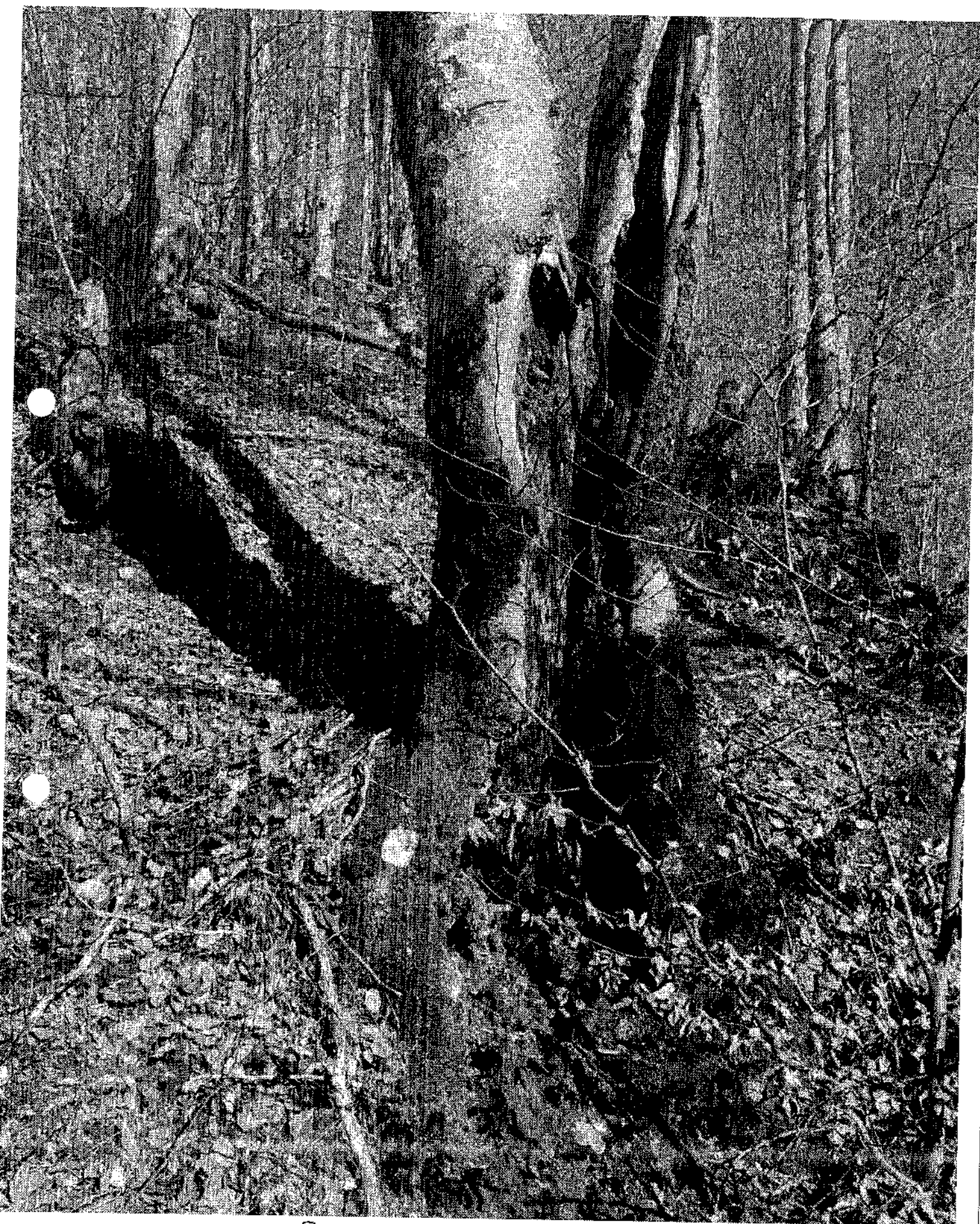
45 E U9 191 comp. Neogre